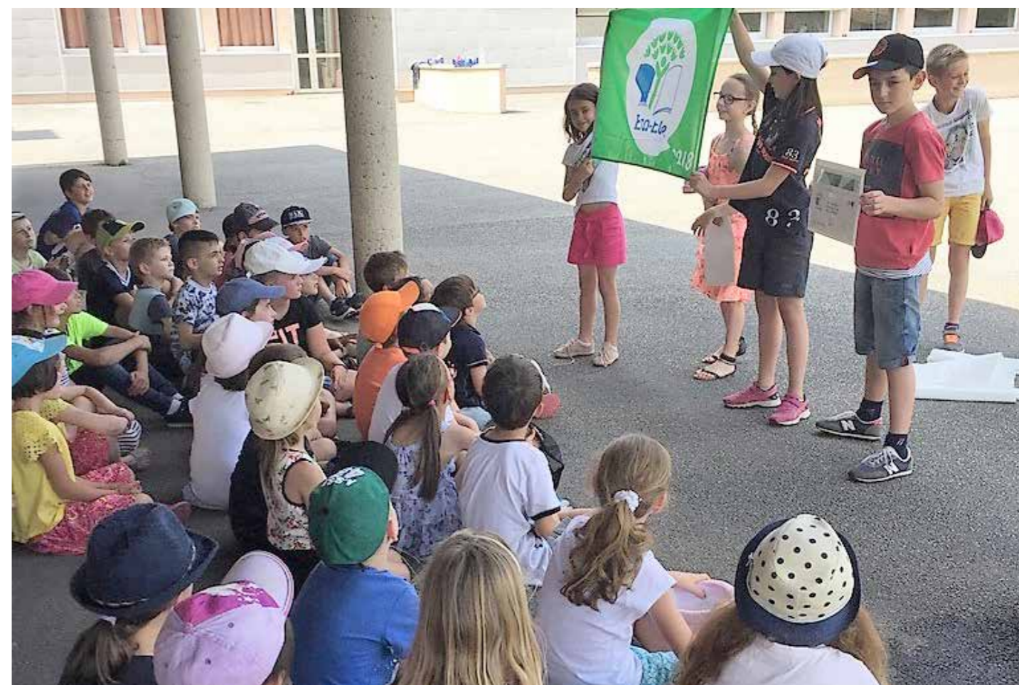
Réception du Label Eco-école

Le 21 juin 2018, nous avons enfin reçu notre Label « Éco-école ». Grâce au travail et à l'implication de chacune et chacun, nous avons réussi et sommes très fiers de faire partie de ce programme international de développement durable.(...)