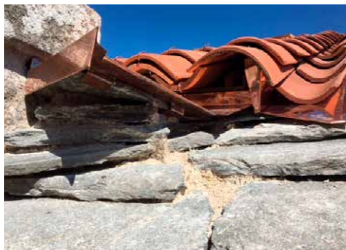
Travaux sur toiture