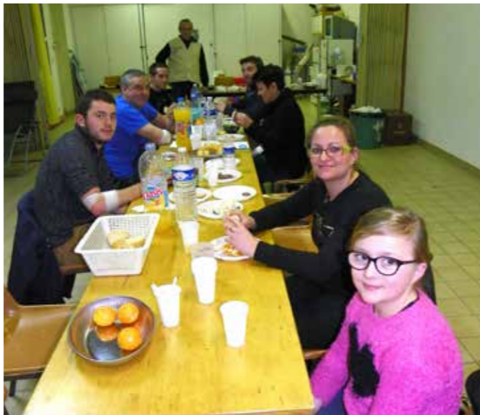
On se restaure