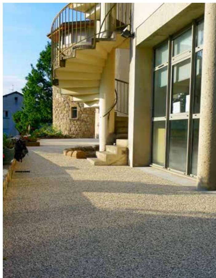
La terrasse de la Maison de retraite

Ces aménagements répondent à la demande des résidents et soignants relayée par le Conseil de la Vie Sociale de l'établissement et validée par son Conseil d'Administration. La Commune, propriétaire des lieux a financé les travaux d'installation de la rampe ; la Maison de retraite la cuisine et le store.