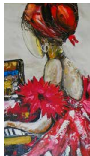
Une fête de couleurs