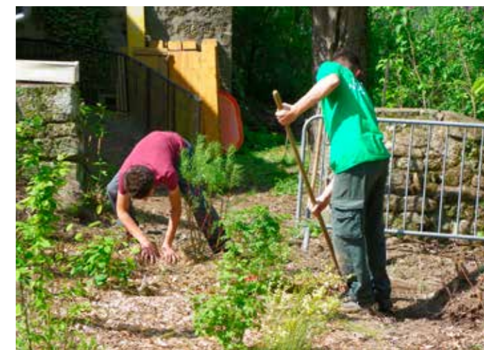
Plantation et paillage