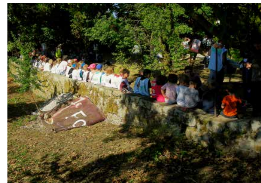
Prêts à s'envoler

L'École Saint Joseph, très active dans ce domaine et qui, d'ailleurs, a gagné le label «Éco École», s'est mobilisée, une fois de plus, ce vendredi 28 septembre. Les élèves, encadrés par leurs enseignantes et des parents volontaires, ont, en effet, participé activement et joyeusement à la Journée «Nettoyons la nature». Revêtus de leur chasuble, ils sont partis à la chasse des débris et en ont rempli plusieurs grands sacs en plastique. Pour les remercier, un goûter écologique et bucolique leur a été offert dans le Parc Communal, situé derrière la Mairie et dont des élèves du Lycée Agricole d'Yssingeaux avaient, du 24 au 28 septembre, continué l'aménagement.