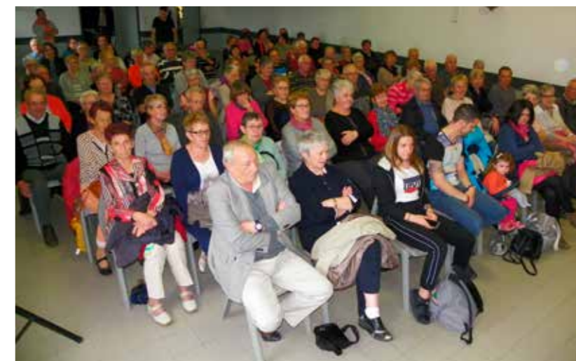
Concert Mouvance 29 avril

Fête de la Musique du 16 juin, coorganisée par la Mairie et l'association des Commerçants, animée en soirée par deux groupes de musiciens.