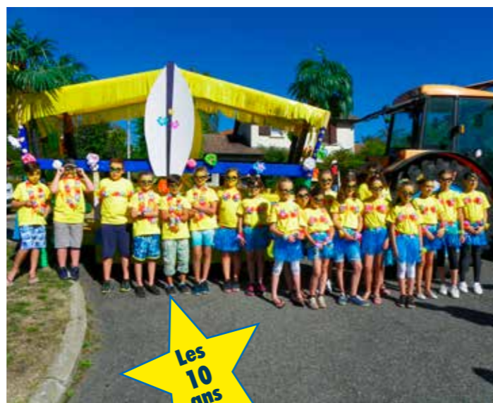
Les 10 ans