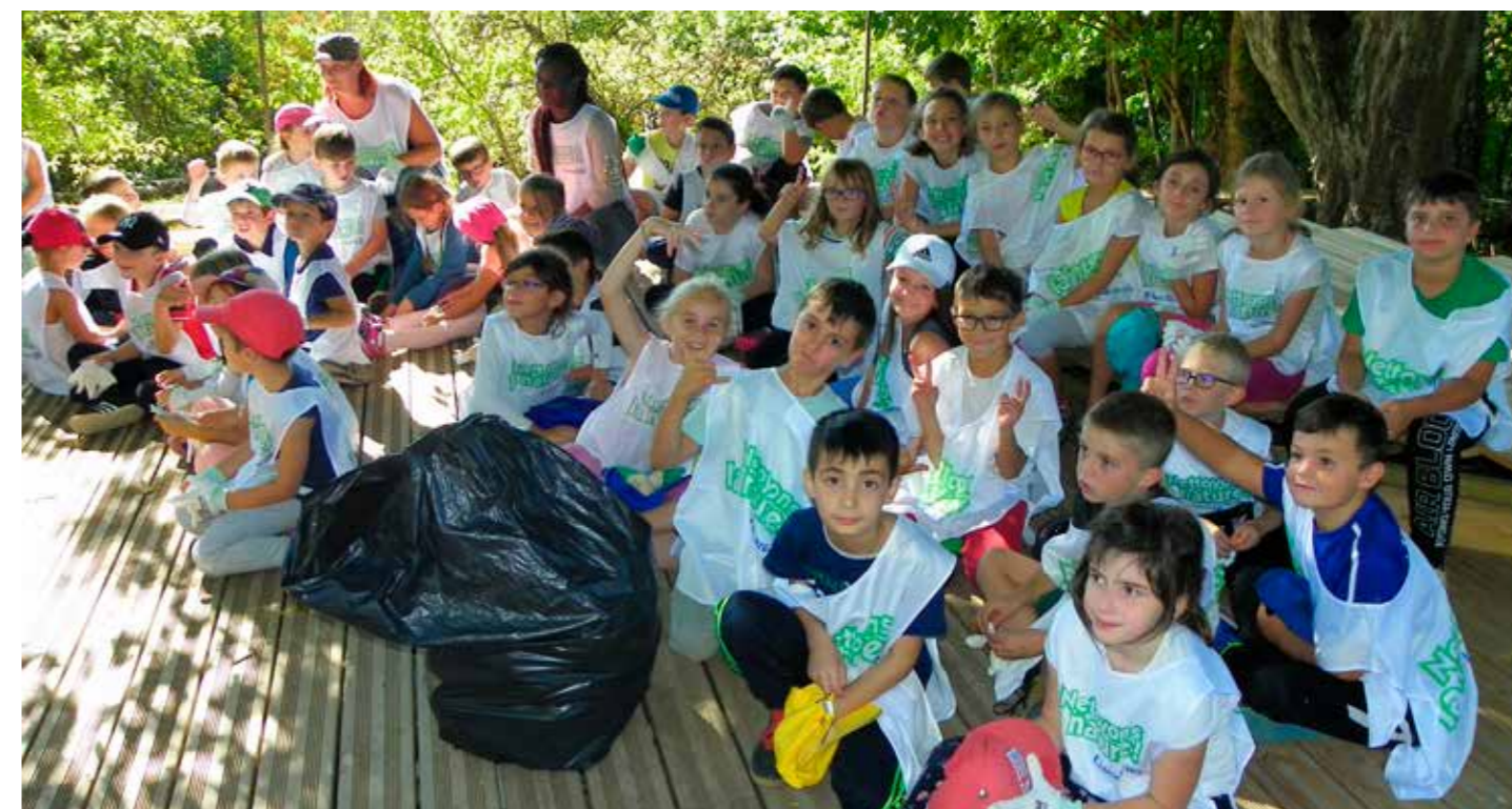
Des élèves heureux