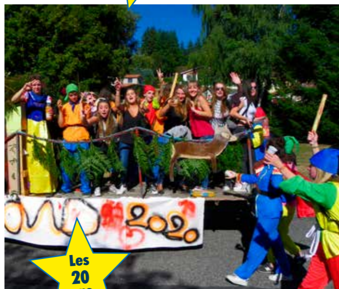
Les 20 ans