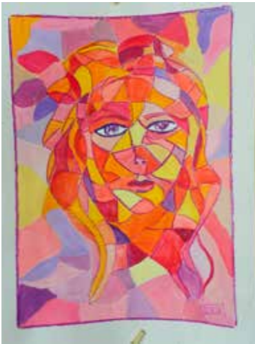
Peinture sur acrylique