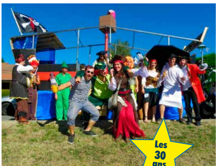
Les 30 ans