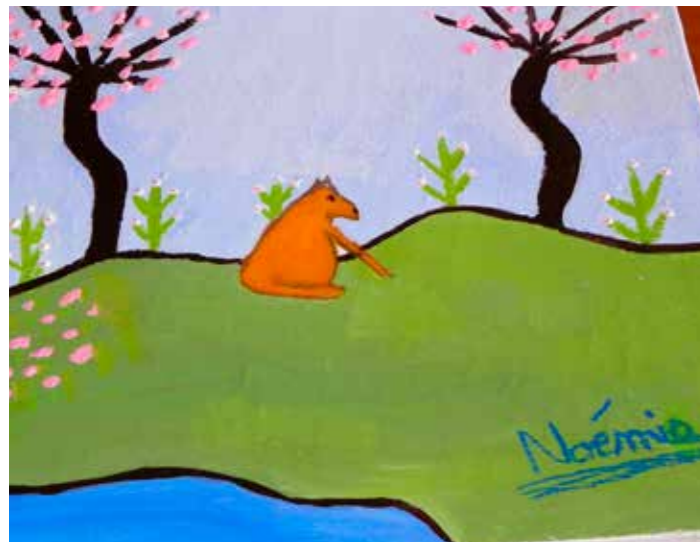
Peinture sur acrylique