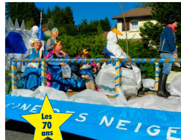
Les 70 ans