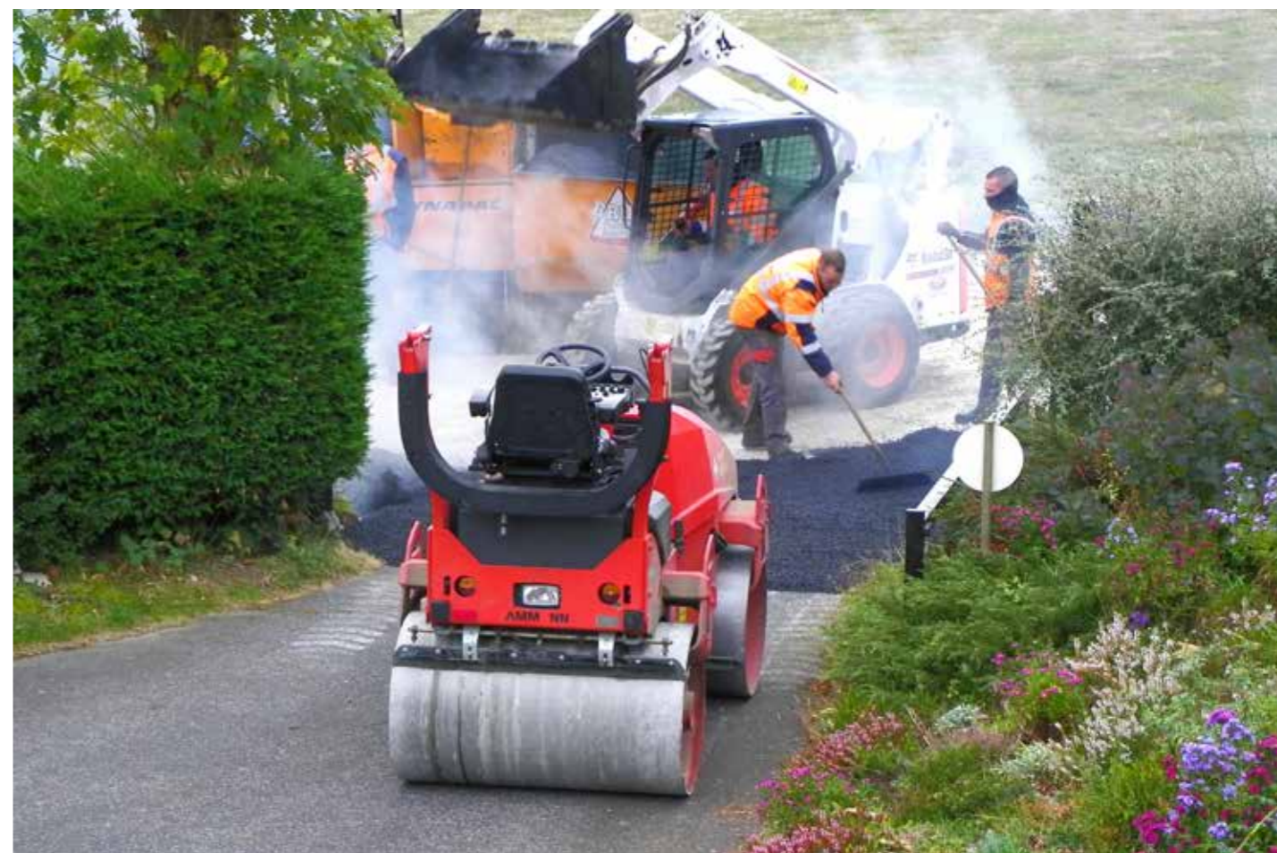
Pose de l'enrobé

Ceux des riverains qui profitent de la présence de l'entreprise pour faire aménager une parcelle privée (une cour, par exemple) le font à leurs frais.