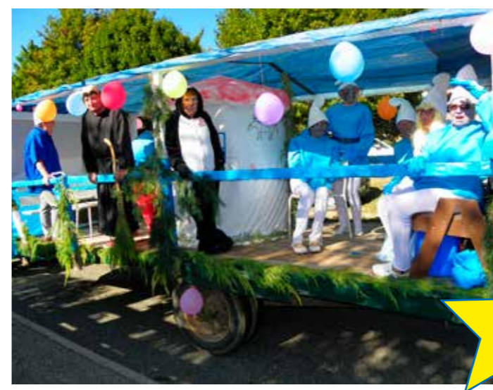
Les 80 ans