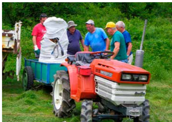
Le transport de la cloche