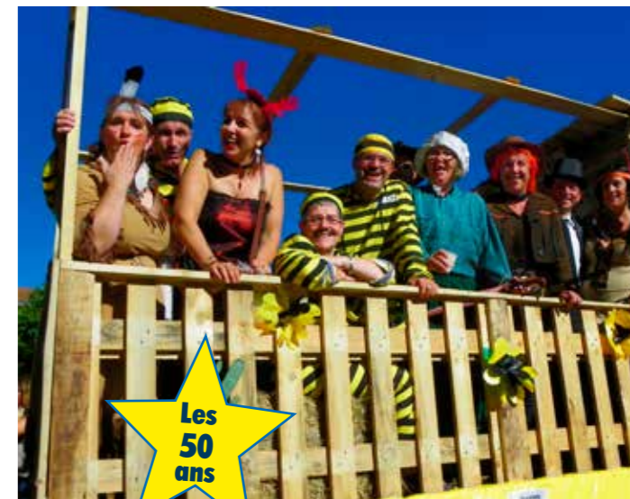
Les 50 ans