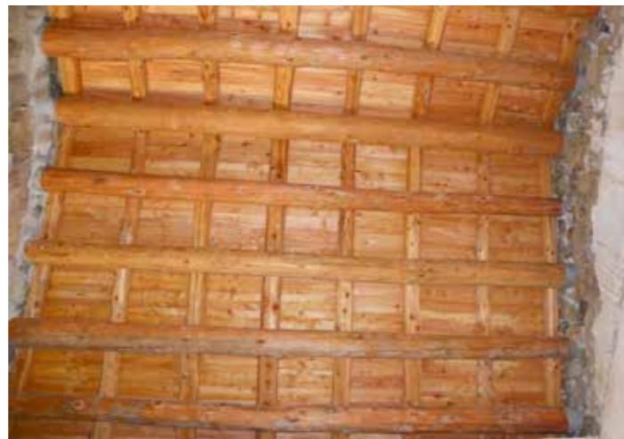
Charpente après travaux

Ne manque, à ce jour, que la pose de quelques tuiles spéciales, fabriquées à la demande, « biseautées » pour dessiner la forme d'une coquille Saint Jacques, rehaussant ainsi l'originalité de l'édifice.