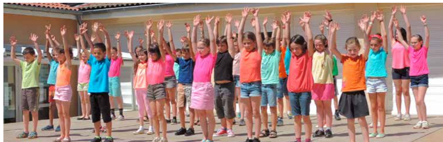
Lors de la kermesse