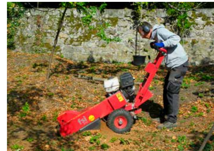
Désouchage à la rogneuse

Il sera accessible au public une fois toutes les opérations d'aménagement, d'accessibilité et de sécurisation réalisées.