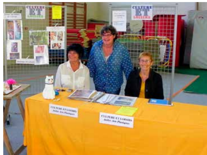
La présidente et l'animatrice Arts Plastiques