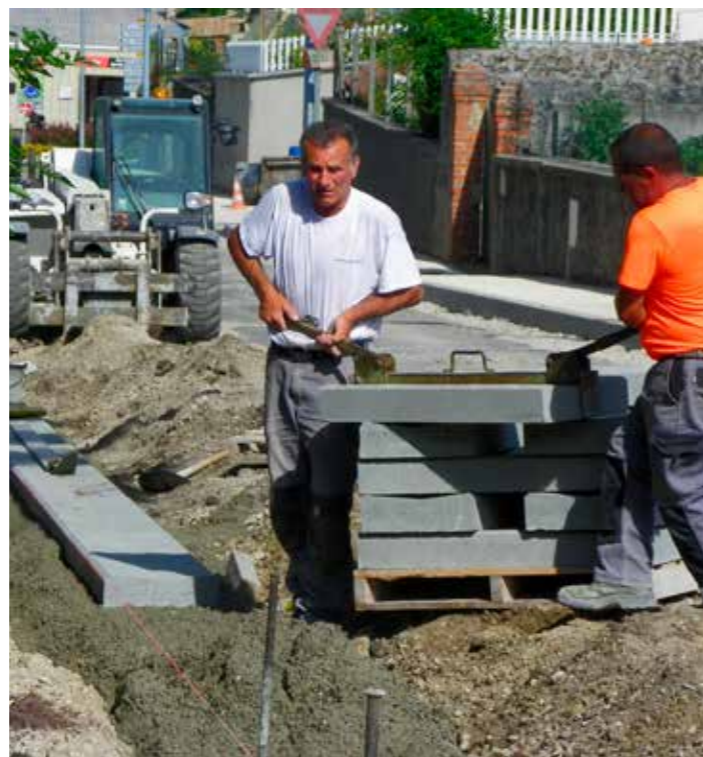
Pose des caniveaux

Des passages protégés pour aller d'un trottoir à l'autre seront installés plus tard. Un sens de circulation routière alternée sera mis en place dans le haut de la rue (avec priorité aux véhicules qui montent).