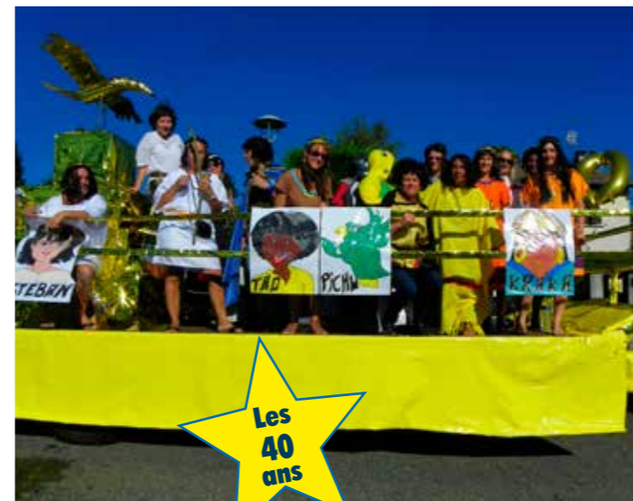
Les 40 ans