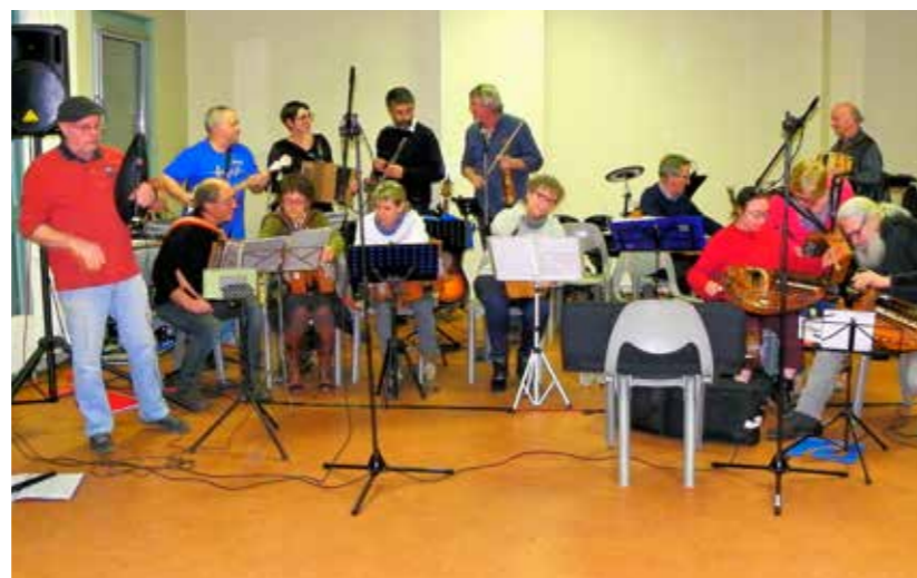
Passe ton morceau

Le vendredi soir, 2 mars 2018, quelque quatre vingts personnes ont chanté, dansé, applaudi aux morceaux de musique traditionnelle joués par le groupe «Passe ton morceau» et aux chansons interprétées par le groupe «2Cé3B».