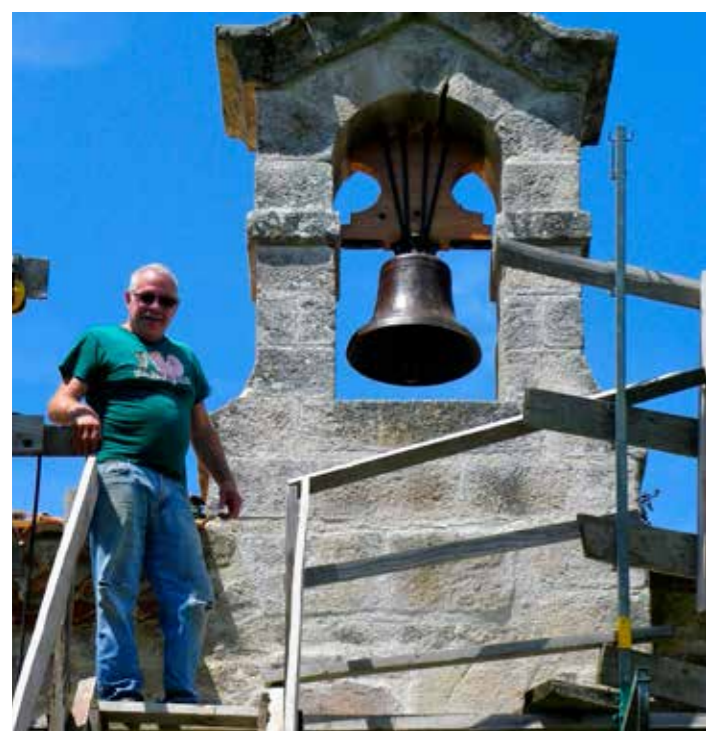
L'installation de la cloche