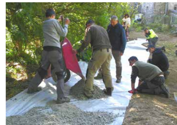
Habillage du sentier