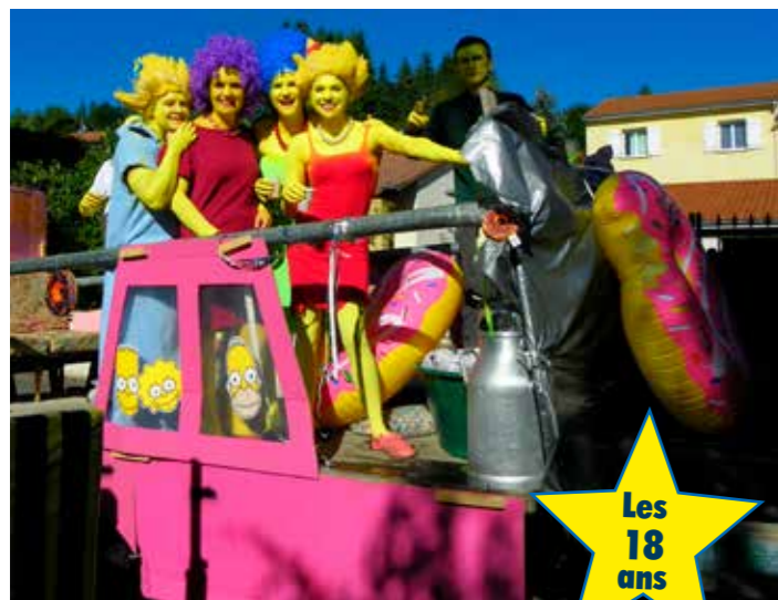
Les 18 ans