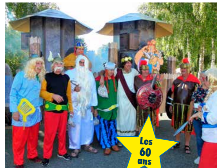
Les 60 ans